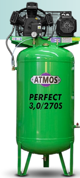
na vertikálním vzdušníku