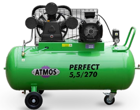
na horizontálním vzdušníku